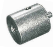
LH 7 / 8